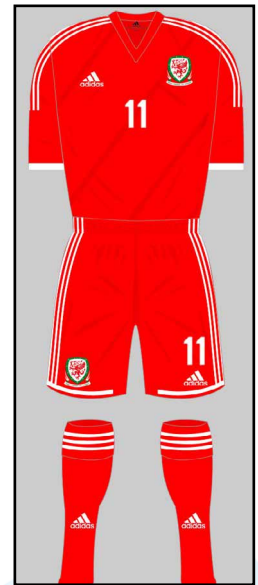
Dillad chwaraeon 4 Pryd?