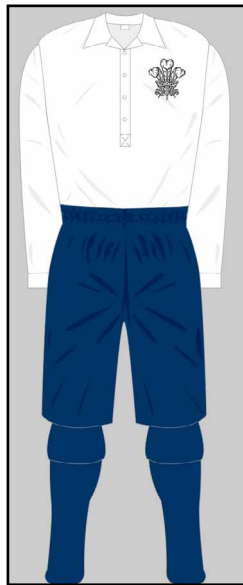
Dillad chwaraeon 2 Pryd?