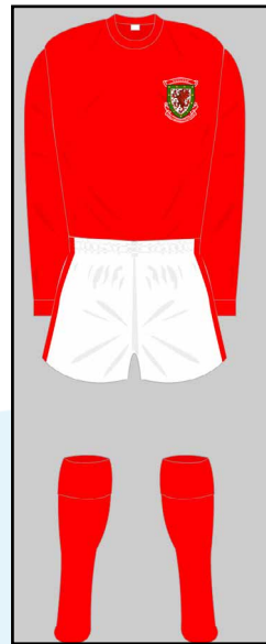
Dillad chwaraeon 3 Pryd?