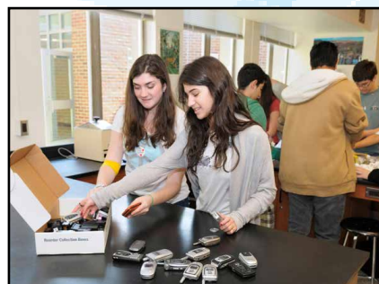
Clwb gwyrdd (Maen nhw'n ailgylchu ffonau.)