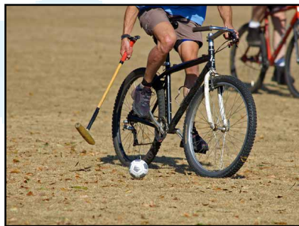
Clwb polo ar feic